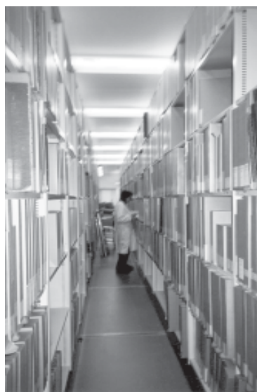
Nytt arkivsystem installerat år 2001

Första åren var arkivens samlade hyllmeter starkt begränsade. Vid starten fanns material för 40 hyllmeter, vilket ökade till 50