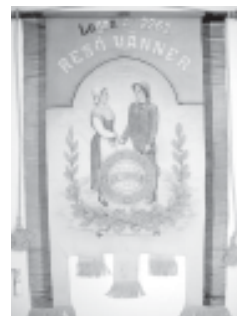
Logen nr. 2262 Resö Vänner