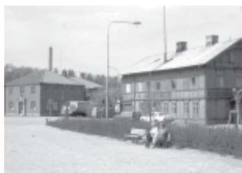
Tullhuset (till vänster) och Bohuslänska Kustens kontor

Första gången vi läser om olika föreningars arkiv är kring åren 1933/1934. I en lokal i Tullhuset fanns arkiv för föreningar, främst fackföreningar. Tullhuset var beläget i Norra Hamnen i