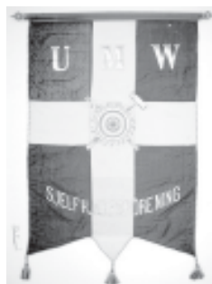
UMW Själfhjelps- förening Uddevalla Mekaniska Werkstad

Mycket unikt för just vårt arkiv är Tidningsarkivet. Vi har mikrofilmer från alla Bohusläns dagstidningar och från dessa har vi dataregistrerat över 90 000 artiklar. Alla våra fanor är numera avfotograferade och förtecknade digitalt, vilket ger en unik sökmöjlighet.