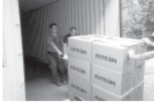
Flyttning av arkivet år 2001 i samband med installation av nya hyllor