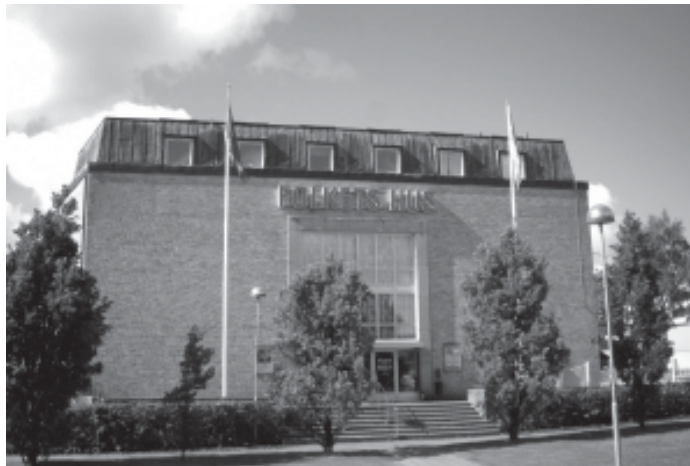
Folkets Hus på Göteborgsvägen i Uddevalla