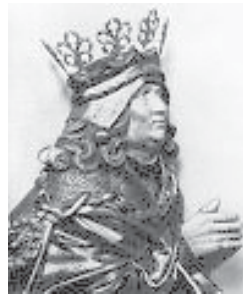
Kung Hans af Danmark