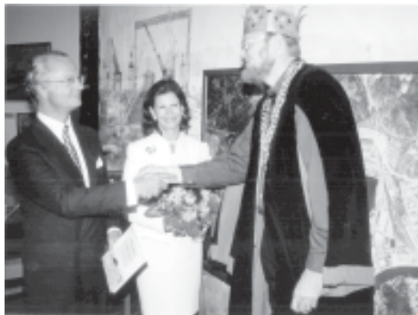
“Kung Hans” hälsar på Kungen och Drottningen