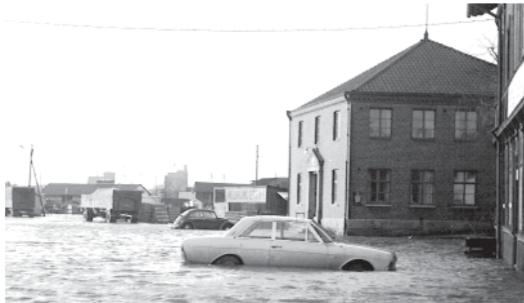
Det kunde vara svåra arbetsförhållande i Tullhuset och ibland svårt att komma till arbetet

Vid årsskiftet 1945/1946 var man tvungna att utrymma lokalen i Tullhuset varför arkivkommittén i samråd med styrelserna för Arbetarkommunen och Fackliga Centralorganisationen flyttade över arkivens inventarier till en för ändamålet inredd lokal i det nybyggda Folkets Hus på Göteborgsvägen. Arkivkommittén rekommenderade också dessa lokaler för arkivens fortsatta verksamhet. Folkets Husstyrelsen var även villig att överta skötseln av arkivet med direkt uthyrning av fack m.m. Hyran för lokalen i sin helhet ställde sig dock för dyr till enbart arkiv, varför arkivkommittén föreslår att skötsel av föreningarnas arkiv överlåtes till Folketshusstyrelsen samt att arkivets inventarier överlämnas till Folkets Hus.